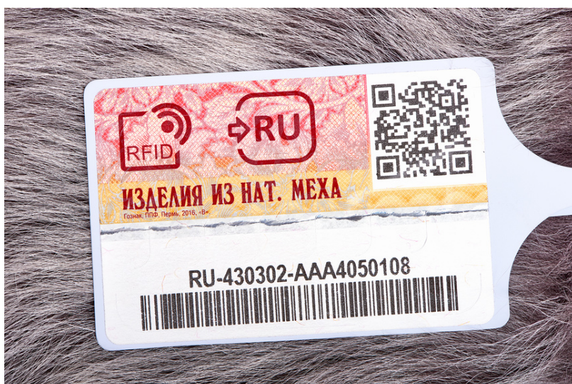
(Пример КИЗ с интернета)